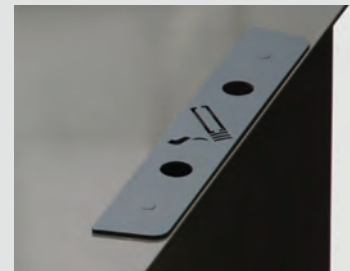
Inhoud van de asbak: 0,1 liter