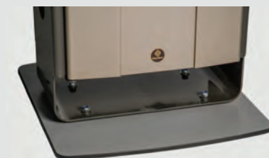
Vrijstaande voetplaat (Enkel beschikbaar voor het 60 liter model)